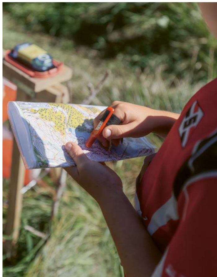
↑ Distrikstävlingen i Hulanskogen lockade både stora och små orienterare. De allra yngsta sprang knattelopp och de äldsta var över 80 år.