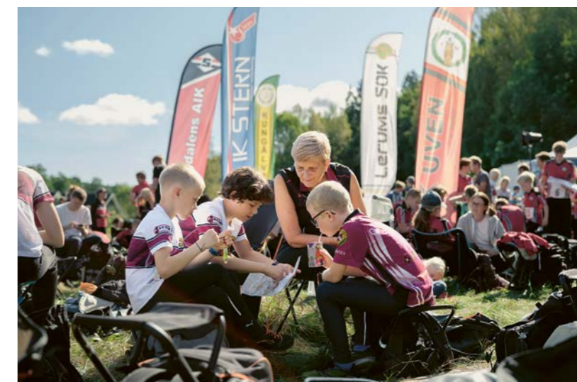
↑ Förbos gräsytor, väster om Mor Annas väg, var tävlingsarena med plats för bajamajor, tält för tävlingsledning, stafetter, grilltält och prova-på-banor.

”Tio, nio, åtta, sju...” Nedräkningen har börjat inför starten i ungdomsstafetten i dagens orienteringstävling. Ett tjugotal ungdomar står på tå för att rycka åt sig kartan som ligger vid deras fötter och sprinta i väg mot första kontrollen.